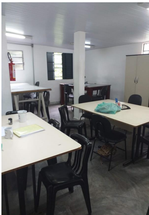
6. SALA DE AGENTE DE SAÚDE