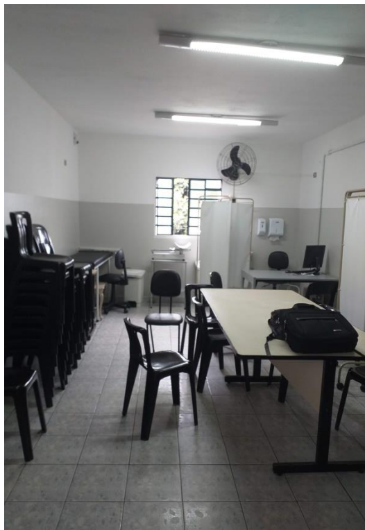
4. SALA DE REUNIÃO