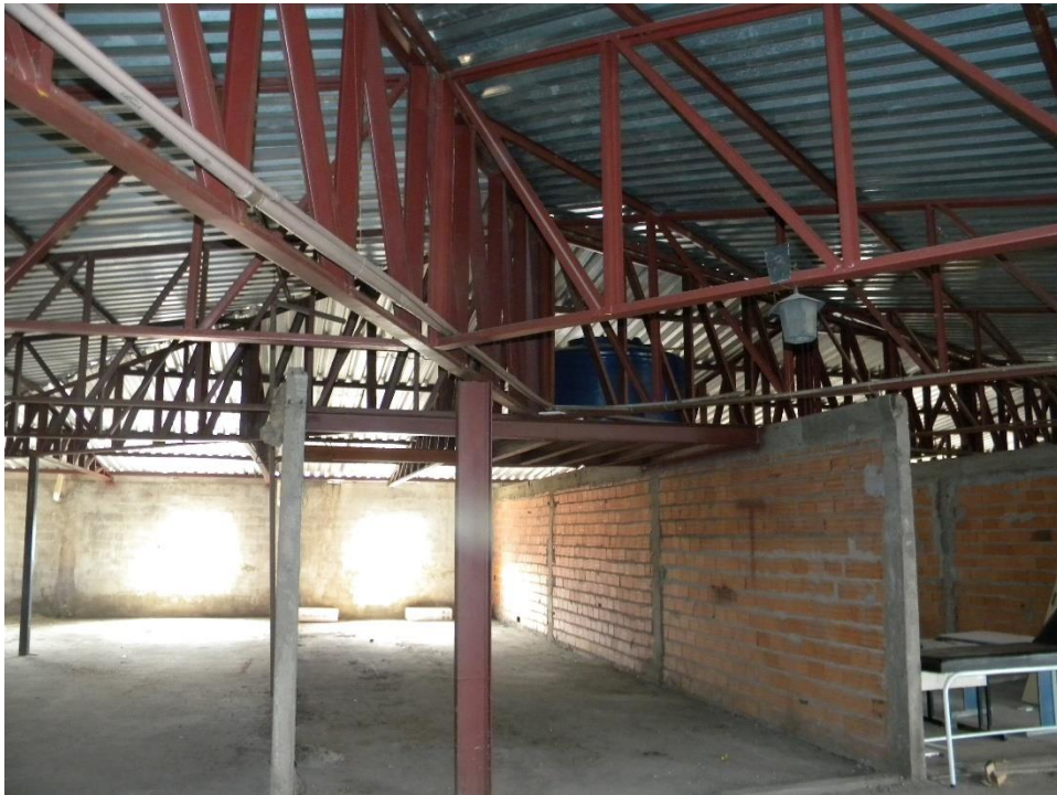
VISTA DA ESTRUTURA METÁLICA DA COBERTURA