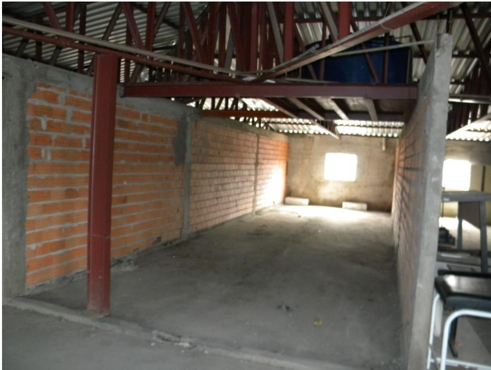
VISTA DA ALVENARIAS INTERNAS EXISTENTES DE TIJOLO CERAMICO